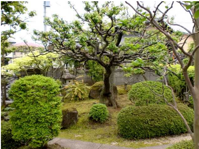
内 庭 3