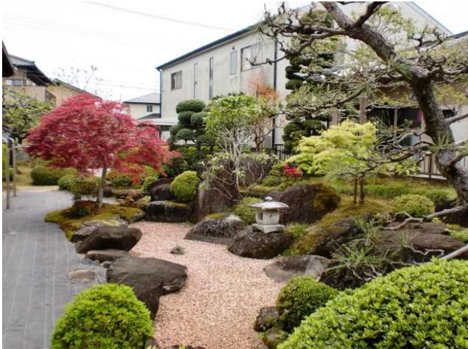
内 庭 1