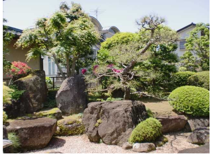
内 庭 2