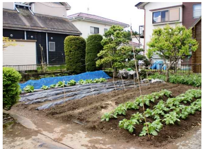
内 庭 4