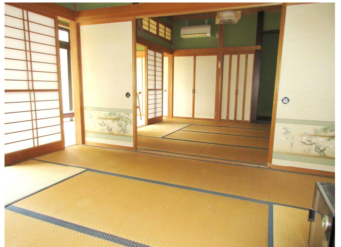
和 室 2