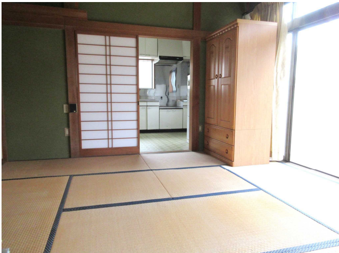
和 室 1