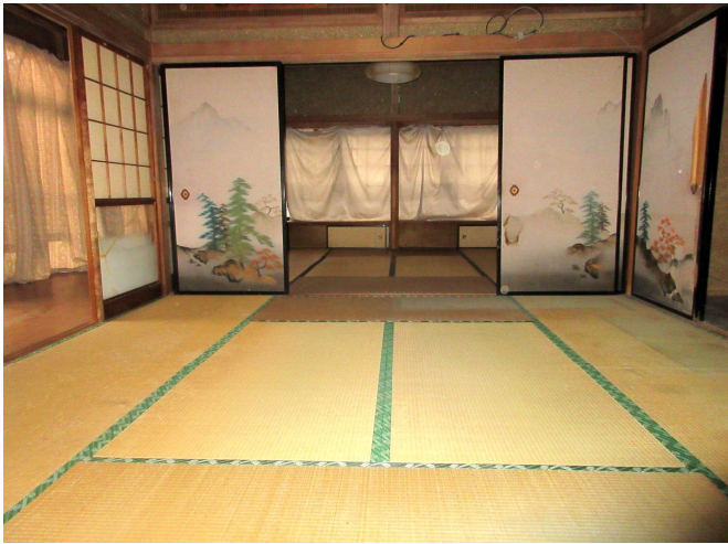
和 室 1