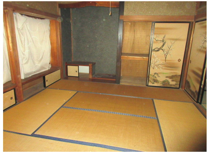
和 室 2