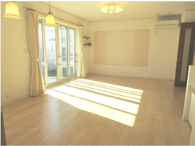
洋 室 1