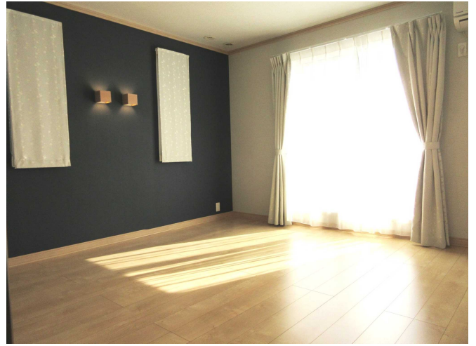
洋 室 2